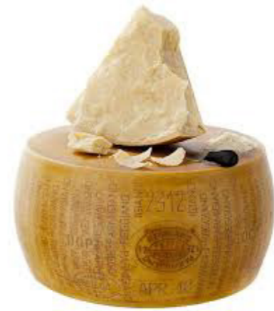
Parmigiano Reggiano DOP whole wheel