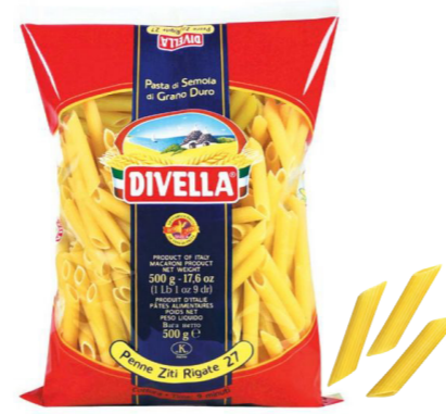
#27 Penne Ziti Rigate