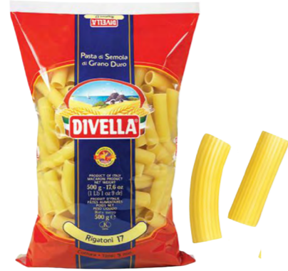
#17 Rigatoni Rigati