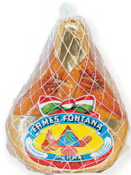
Prosciutto di Parma DOP 14 - 36 months