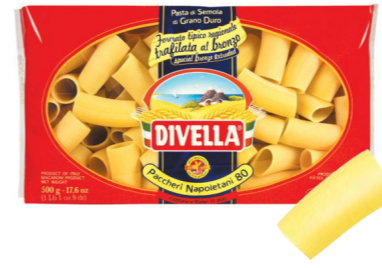
#80 Paccheri Napoletani