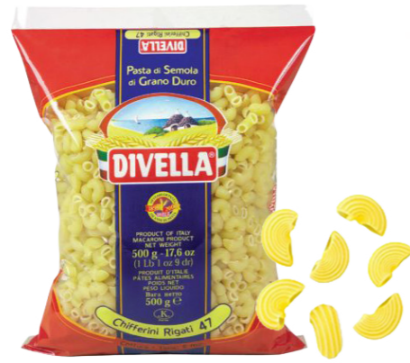
#47 Chifferini Rigati