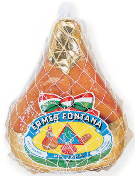
Prosciutto Crudo Nazionale 12 - 14 months