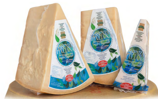
Essenza Italiana over 16 - 18 months whole wheel