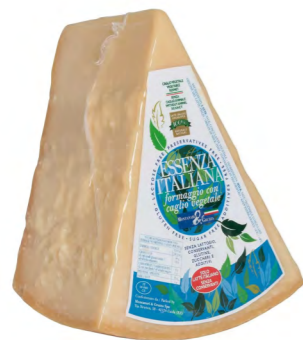
Essenza Italiana 16 - 18 months