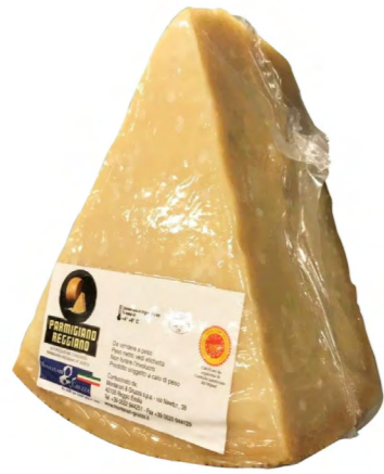
Parmigiano Reggiano DOP 24 - 36 months